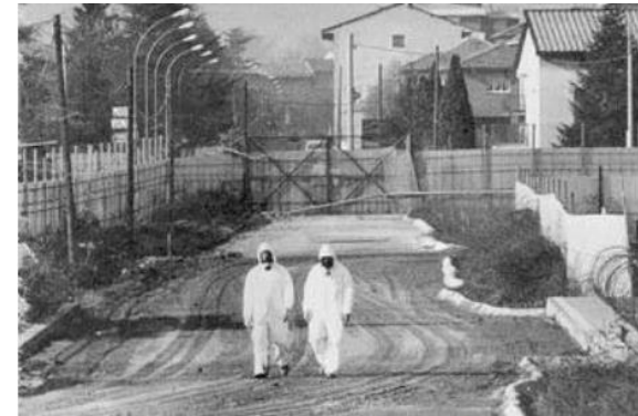
Εργάτες με ειδικές προστατευτικές στολές προσπαθούν να απολυμάνουν το Σεβέζο. Λίγες μέρες μετά το «ατύχημα» και ενώ η πόλη έχει εκκενωθεί.

1976 διαρροή Διοξίνης στην ατμόσφαιρα από εργοστάσιο παραγωγής χημικών.