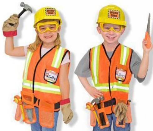
Οι φίλοι μου