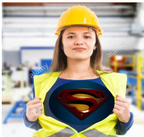
Τι πιστεύω ενδόμυχα