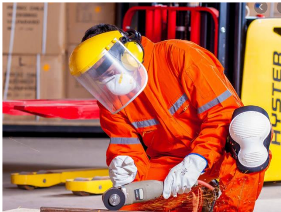
Η μητέρα μου